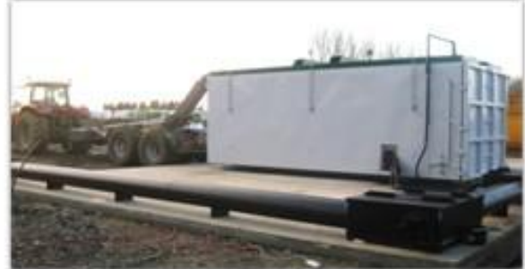
Livraison d'un digesteur sur la plateforme