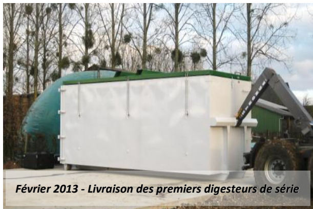
Février 2013 - Livraison des premiers digesteurs de série

Deux ans après la présentation au SIMA 2011 d'un digesteur prototype, vous pourrez découvrir un digesteur de série, fabriqué en France, qui va révolutionner les pratiques agricoles de milliers d'exploitations du territoire national.